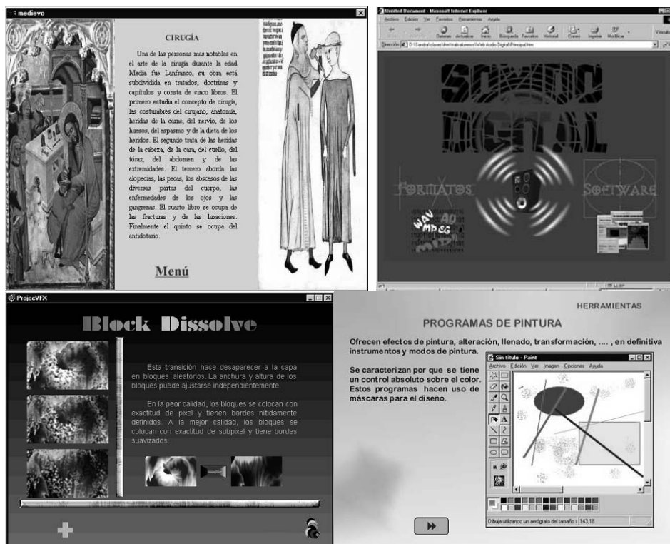
Figura 2: Trabajos presentados por los alumnos de IPO